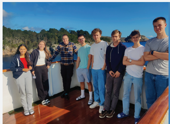
Fra åpningstoktet i september

13. – 17. november Trenings- og rekrutteringstokt til Vestlandet Leirvik, Bergen og Haugesund. I Samarbeid med Maritim opplæring Sørvest